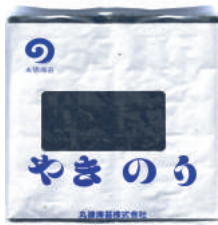
焼のり全型 全型100枚×6