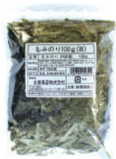
もみのり100g B 100g×10