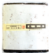
板のり全型 全型100枚×6