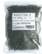
刻みのり100g B 100g×10