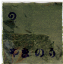
焼のり2切 (ヨコ) 2切200枚×6