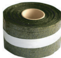
焼のりロール 400枚×6巻