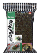
■きざみのり 入数(10×4)×1 内 容 量 12g 商品寸法・重量 240×135×15 440g J A N コード 4902799021159 価 格 210円