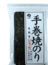
■手巻焼のり40枚 入数(10×4)×1 内 容 量 2切40枚 商品寸法・重量 278×165×30 144g J A N コード 4902799403337 価 格 700円