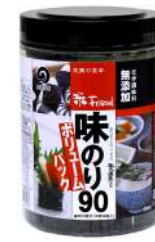
■ポリウムパック90 入数20×1 内 容 量 10切90枚 商品寸法・重量 100×100×150 160g J A N コード 4902799254816 価 格 460円