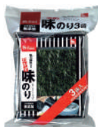
■藻塩味のりおかず3袋N 入数40×1 内 容 量 8切6枚3袋入 商品寸法・重量 165×110×50 56g J A N コード 4902799353113 価 格 175円