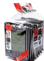
■藻塩味のりおかず8袋N 入数12×1 内 容 量 8切6枚8袋入 商品寸法・重量 140×120×160 150g J A N コード 4902799353175 価 格 445円