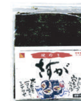
■さすが焼のり10枚 入数(10×4)×1 内 容 量 板のり10枚 商品寸法・重量 270×220×10 78g J A N コード 4902799302012 価 格 480円