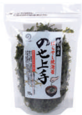
■のせ上手ばら干し焼のり15g 入数20×1 内 容 量 15g 商品寸法・重量 240×160×75 24g J A N コード 4902799760058 価 格 500円

この干し海苔は、甘辛い味付けで、おにぎりや、握り寿司、巻物などに最適です。味付けは、お好みで調整できます。また、おにぎりや、握り寿司、巻物などに最適です。味付けは、お好みで調整できます。