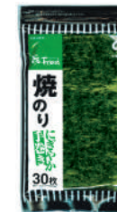
■にぎやか手巻30枚 入数(10×4)×1 内 容 量 2切30枚 商品寸法・重量 265×170×25 96g J A N コード 4902799403092 価 格 610円