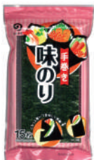
■手巻き味のり15枚 入数(10×4)×1 内 容 量 2切15枚 商品寸法・重量 265×150×25 70g J A N コード 4902799253178 価 格 375円