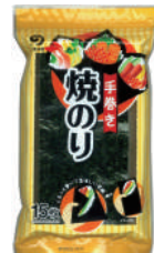
■手巻き焼のり15枚 入数(10×4)×1 内 容 量 2切15枚 商品寸法・重量 265×150×25 70g J A N コード 4902799403139 価 格 375円