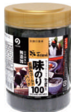
■味のりVPG100 入数(12×2)×1 内 容 量 10切100枚 商品寸法・重量 100×100×150 160g J A N コード 4902799257312 価 格 550円

栄養豊富で低カロリーの海苔は、毎日食べたい健康食品。おむすびや海苔巻きはもちろんな、こんなお手軽アイデアで、毎日の食卓に是非お使いください。