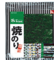
■焼のり徳用7枚 入数(10×4)×1 内 容 量 板のり7枚 商品寸法・重量 270×220×10 78g J A N コード 4902799401074 価 格 340円