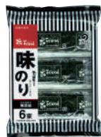
■藻塩味のり6束 入数(10×4)×1 内 容 量 12切5枚6束詰 商品寸法・重量 225×165×20 65g J A N コード 4902799013130 価 格 195円