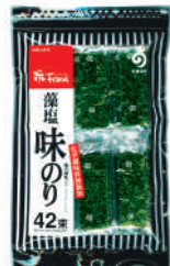
■藻塩味のり42束 入数 12×1 内 容 量 12切5枚42束詰 商品寸法・重量 310×190×30 140g J A N コード 4902799003018 価 格 710円